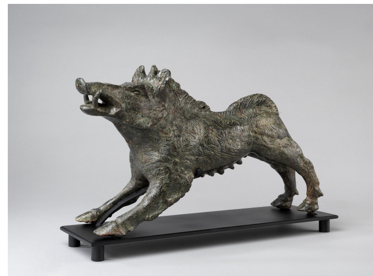
Laie 58 av. J.-C. Bronze Musée H. Martin Cahors